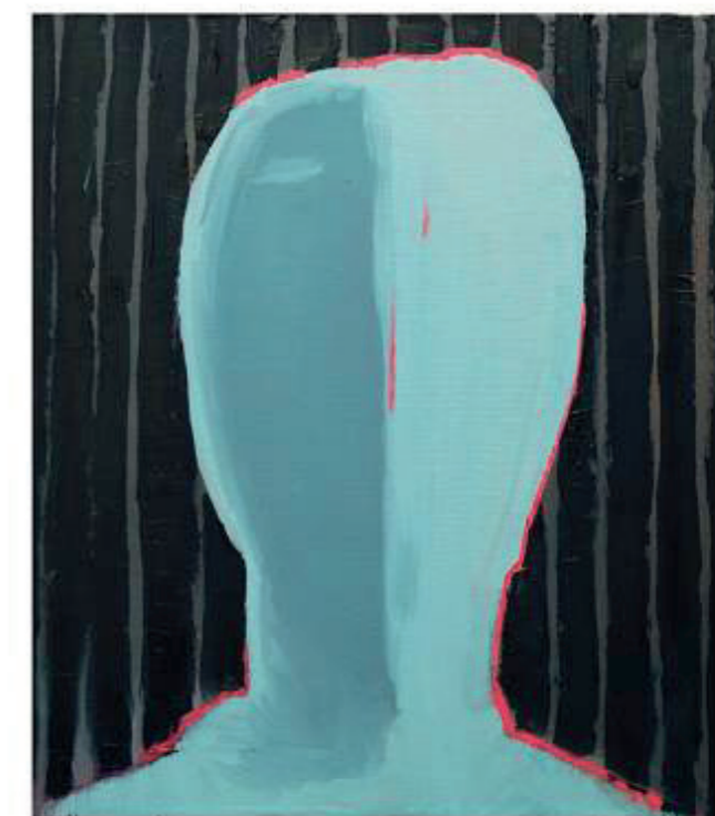
GŁOWA I, II, 2012 olej na płótnie, 50x45 cm