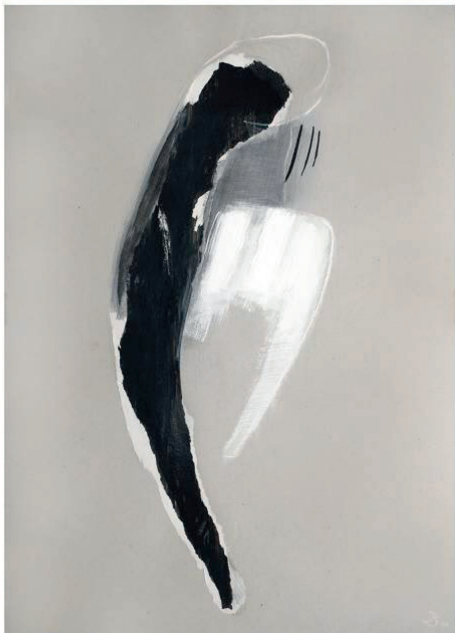
UKRZYŻOWANA I, 2011, tech. mieszana na tekturze, 100x70 cm