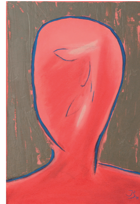
POETYKA GŁOWY II, 2019, olej na płótnie, 55 x 38 cm HEAD POETICS II, 2019, oil on the canvas, 55 x 38 cm