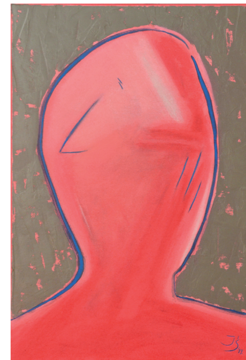
POETYKA GŁOWY IV, 2019, olej na płótnie, 55 x 38 cm HEAD POETICS IV, 2019, oil on the canvas, 55 x 38 cm