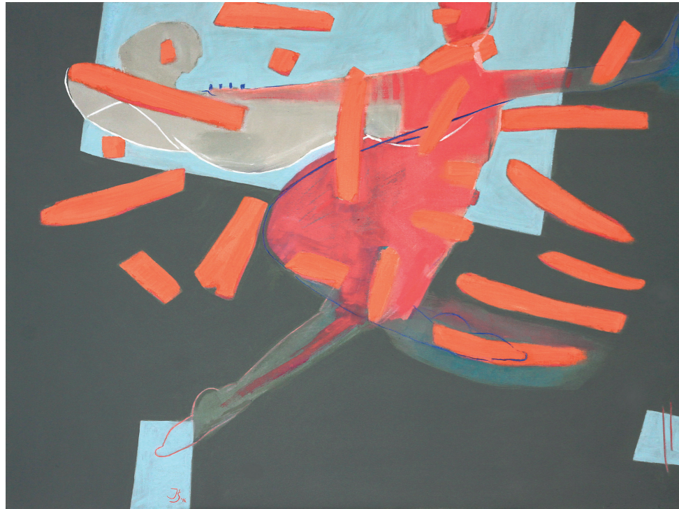
CODZIENNA LEKKOŚĆ BYTU, 2016, olej na płótnie, 110 x 146 cm THE EVERYDAY LIGHTNESS OF BEING, 2016, oil on the canvas, 110 x 146 cm