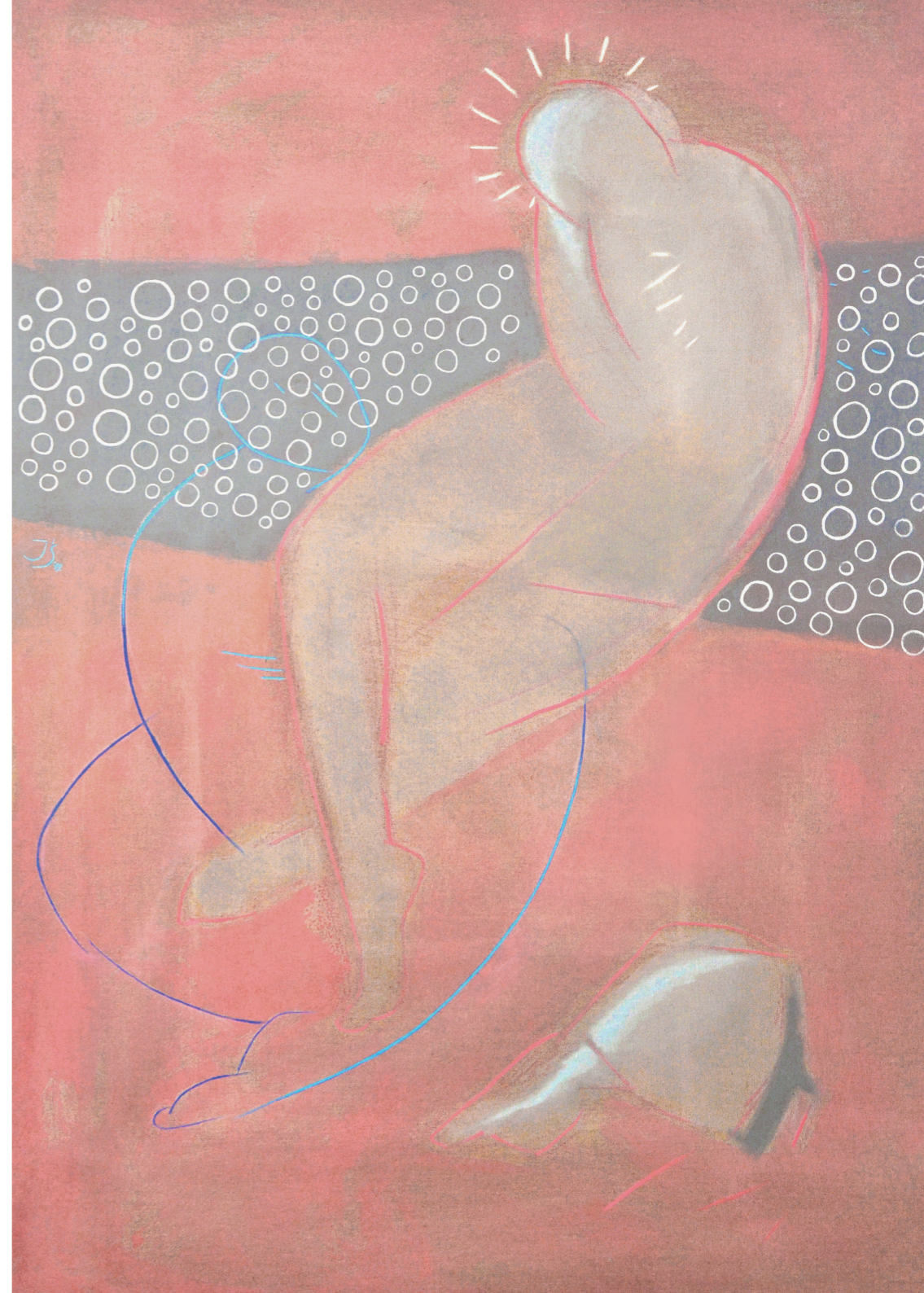
EPIZOD RODZINNY III, 2019, olej na płótnie, 150 x 105 cm A FAMILY EPISODE III, 2019, oil on the canvas, 150 x 105 cm