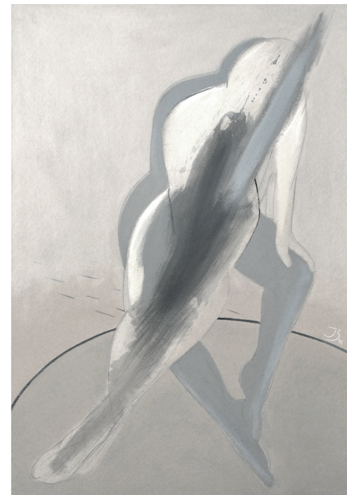
DUET LIRYCZNY V, 2019, akryl na tekturze, 100 x 70 cm LYRICAL DUO V, 2019, acrylic on the cardboard, 100 x 70 cm