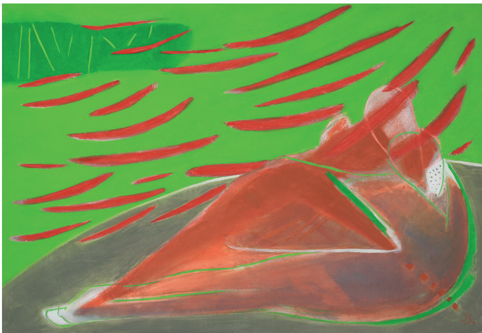
WSZYSTKO DOOKOŁA, 2016, olej na płótnie, 104 x 151 cm THE SURROUNDINGS, 2016, oil on the canvas, 104 x 151 cm