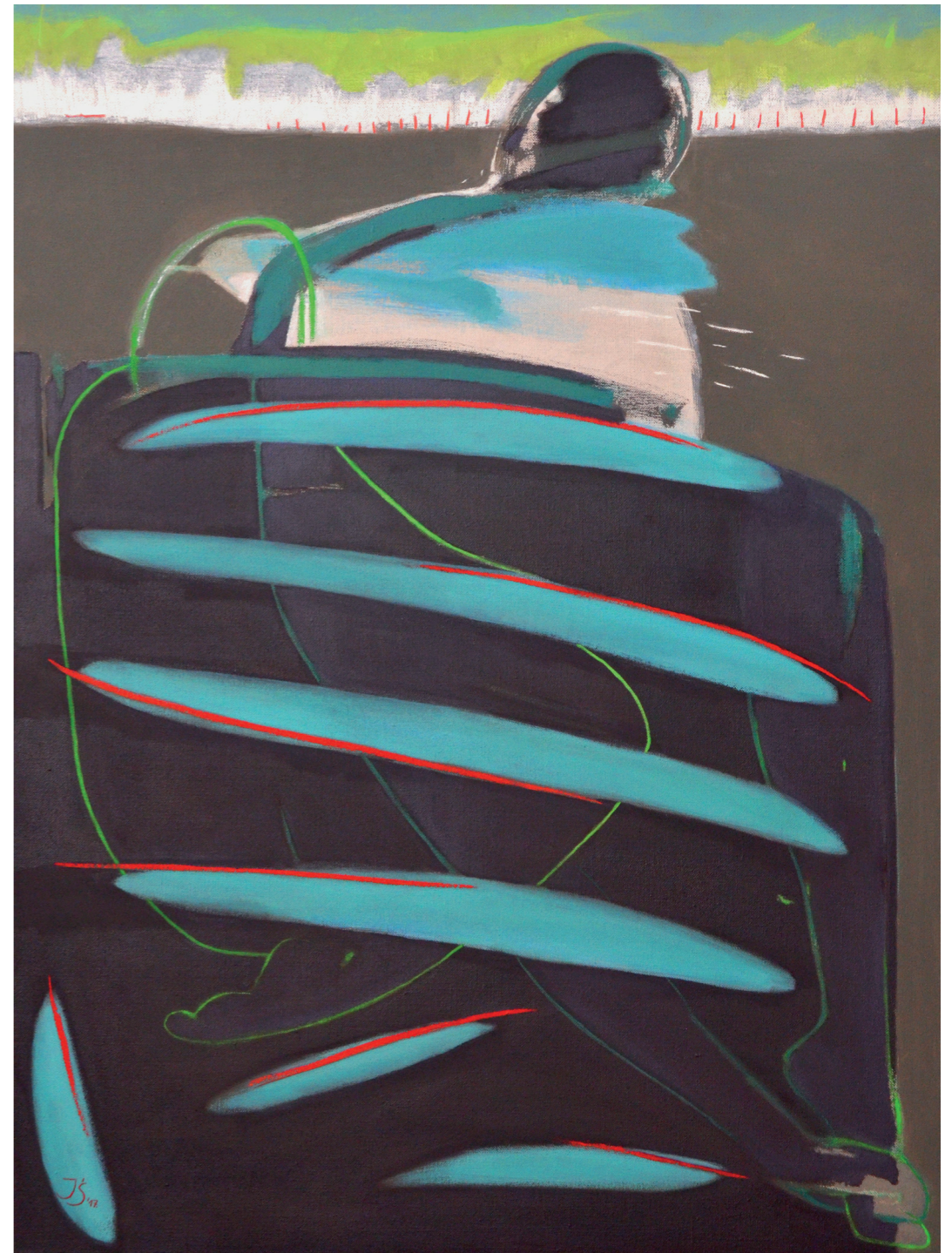
WYCZEKIWANIE, 2017, olej na płótnie, 120 x 90 cm EXPECTANCY, 2017, oil on the canvas, 120 x 90 cm