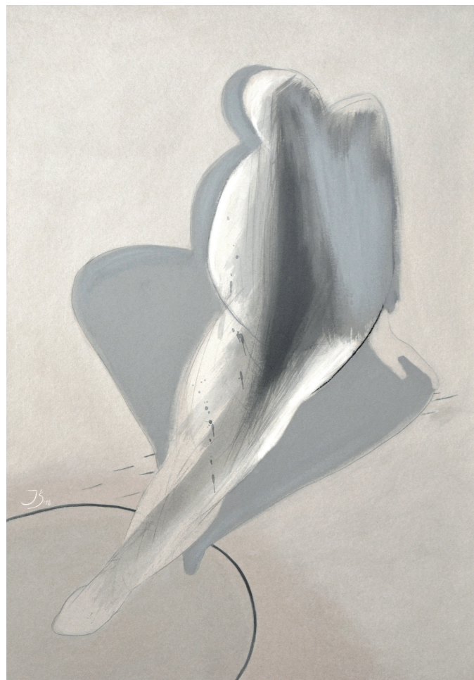
DUET LIRYCZNY I, 2019, akryl na tekturze, 100 x 70 cm LYRICAL DUO I, 2019, acrylic on the cardboard, 100 x 70 cm