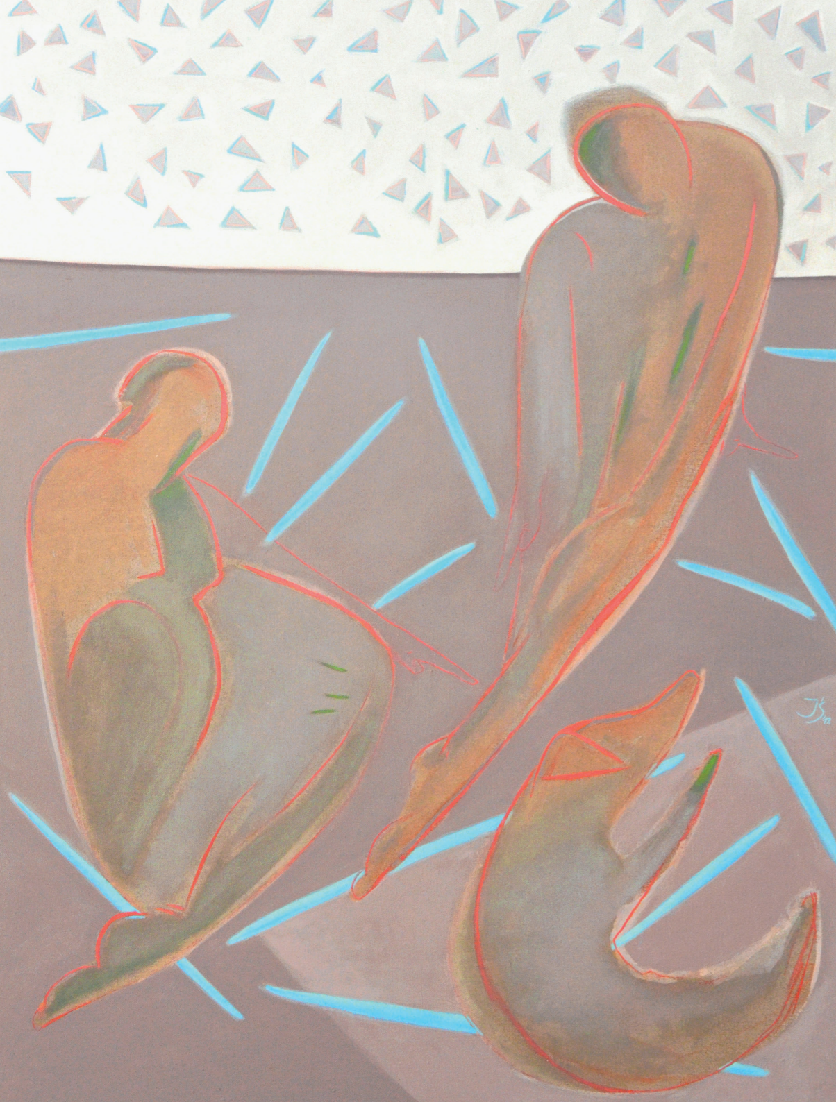
EPIZOD RODZINNY I, 2019, olej na płótnie, 146 x 110 cm A FAMILY EPISODE I, 2019, oil on the canvas, 146 x 110 cm