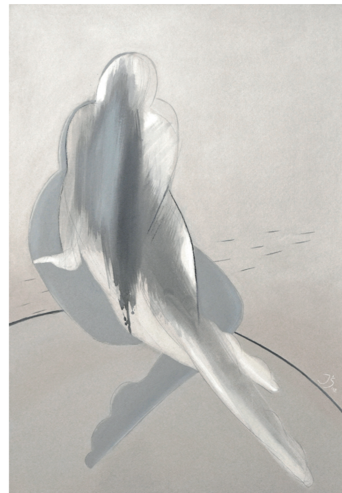
DUET LIRYCZNY IV, 2019, akryl na tekturze, 100 x 70 cm LYRICAL DUO IV, 2019, acrylic on the cardboard, 100 x 70 cm