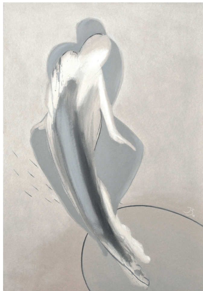
DUET LIRYCZNY III, 2019, akryl na tekturze, 100 x 70 cm LYRICAL DUO III, 2019, acrylic on the cardboard, 100 x 70 cm