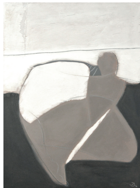
SZARE WSPOMNIENIE IGRZYSK, 2019, technika mieszana na plycie, 139 x 102 cm A GREY MEMORY OF THE GAMES, mixed technique on the wood plate, 139 x 102 cm