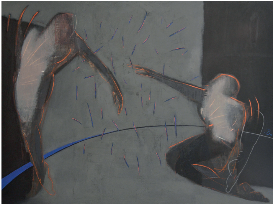
NA ELIPSIE INTYMNOŚCI II, 2018, olej na płycie, 103 x 139 cm ON THE ELLIPSE OF INTIMACY II, 2018, oil on the wood plate, 103 x 139 cm